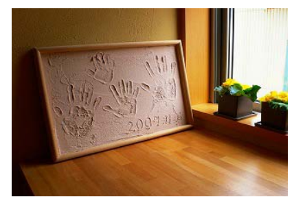
残った材料でつくった、家族の手形パネル。

楽しもう通信は3月末ごろ完成の予定です。ギャラリー空での「住まいづくりフェア」ではお披露目できそうですので、桜の季節にぜひお越し下さい。